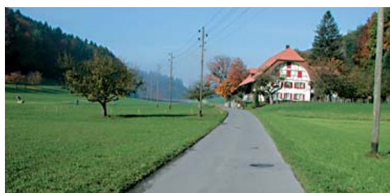
Verkehrssarme Nebenstrasse ohne Trottoir, Fuss- und Radweg