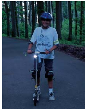
Ausrüstung bei schlechter Sicht und in der Nacht

mit einem nach vorne weiss und nach hinten rot leuchtenden, gut erkennbaren Licht ausrüsten.